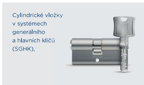
Cylindrické vložky v systémech generálního a hlavních klíčů (SGHK),